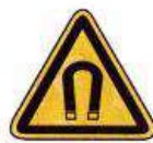
Erős mágneses tér