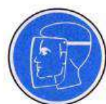
Arcvédő használata kötelező