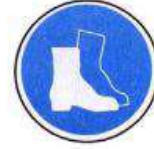
Lábvédő használata kötelező