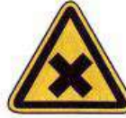
Ártalmas vagy ingerítő anyag