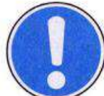
Általános utasítás (kiegészítő jelzéssel)