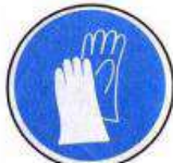
Védőkesztyű használata kötelező