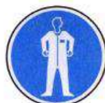
Védőruha használata kötelező