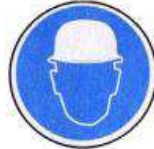
Fejvédő használata kötelező