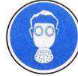
Légzésvédő használata kötelező