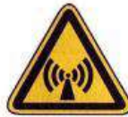
Nem ionizáló sugárzás