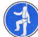
Testheveder használata kötelező