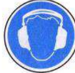
Hallásvédő használata kötelező