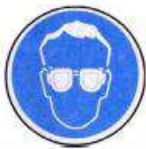
Védőszemüveg használata kötelező